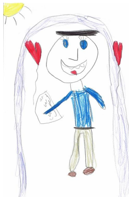
Dziadek Oliwii Cz. (5 lat)